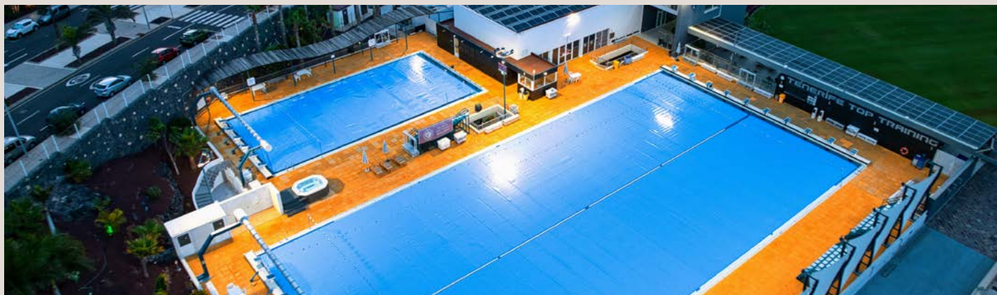
COUVERTURE EN MOUSSE SUPERFLEX 8mm | 50 m x 25 m et 25 x 12,50 | TENERIFE TOP TRAINING SUPERFLEX FOAM COVER 8mm | 50 m x 25 m and 25 m x 12.50 m | TENERIFE TOP TRAINING

Selection of roller system projects featuring various levels of customisation.