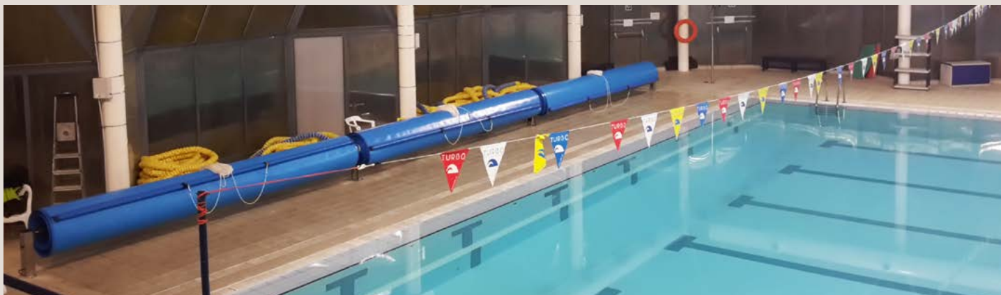
COUVERTURE EN MOUSSE PE 5 mm | 50 m x 16,62 m avec ENROULEUR FIXE RACCORDE motorisé UNIVERSITAT POLITÈCNICA DE VALÈNCIA

PE FOAM COVER 5 mm | 50 m x 16.62 m with FIXED SPLICED motorised roller UNIVERSITAT POLITÈCNICA DE VALÈNCIA