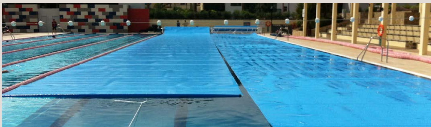
COUVERTURE EN MOUSSE PE 5 mm | 50 m x 21 m avec ENROULEUR MON-12 mobile motorisé HÔTEL LAS PLAYITAS (FUERTEVENTURA) PE FOAM COVER 5 mm | 50 m x 21 m with MON-12 motorised mobile ROLLER HOTEL LAS PLAYITAS (FUERTEVENTURA)