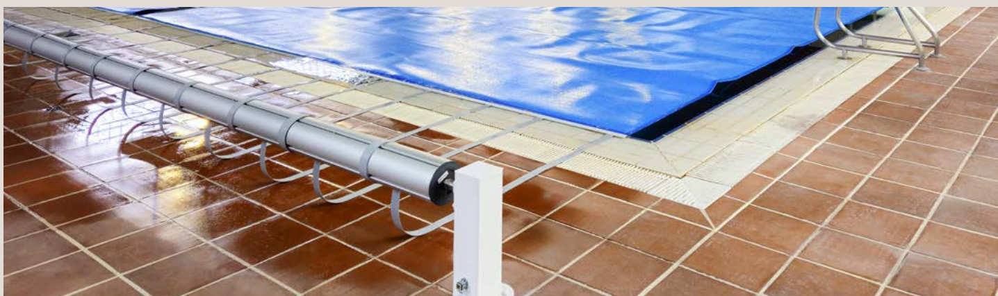
COUVERTURE EN MOUSSE PE 5 mm | 25 m x 12,5 m avec ENROULEUR FIXE motorisé | PISCINE MUNICIPALE SOTRONDIO

PE FOAM COVER 5 mm | 50 m x 16.62 m with FIXED SPLICED motorised roller UNIVERSITAT POLITÈCNICA DE VALÈNCIA