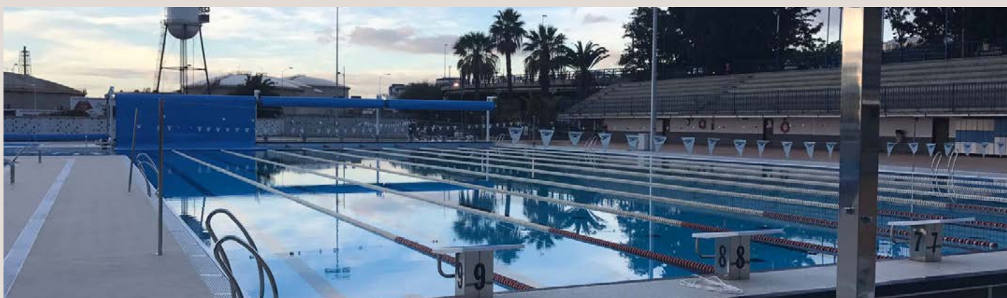
COUVERTURE EN MOUSSE PE 5 mm | 50 m x 33 m avec ENROULEUR FIXE AVEC PIEDS SURÉLEVÉS motorisé PISCINE MUNICIPALE ACIDALIO LORENZO (TENERIFE)

PE FOAM COVER 5 mm | 25 m x 12.5 m with FIXED motorised ROLLER | PISCINA MUNICIPAL SOTRONDIO