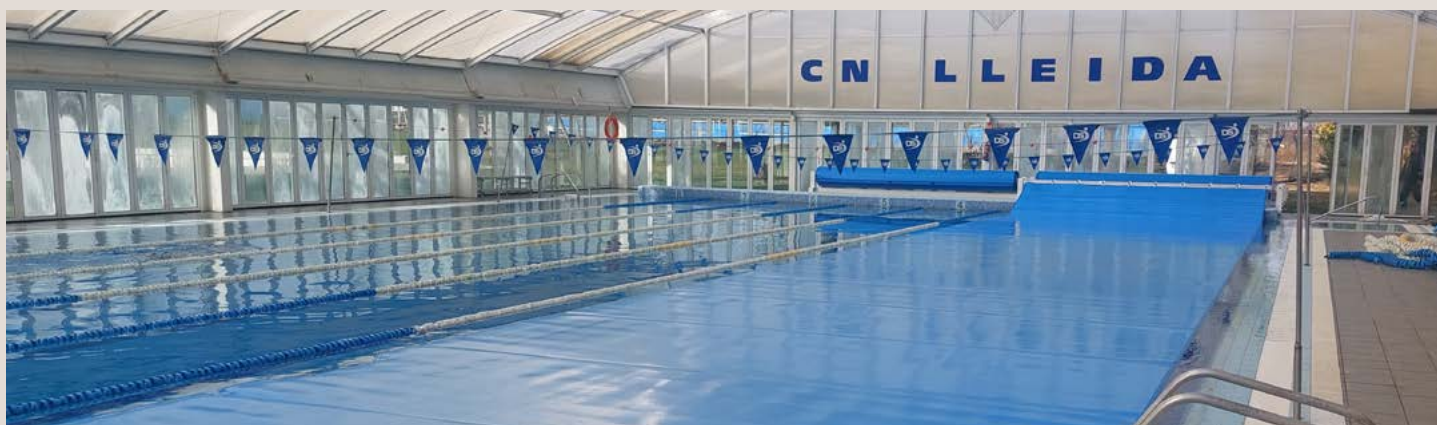
COUVERTURE EN MOUSSE PE 5 mm | 25 m x 12,50 m avec ENROULEUR MON-12 mobile motorisé | CN LLEIDA PE FOAM COVER 5 mm | 25 m x 12.50 m with MON-12 motorised mobile roller | CN LLEIDA